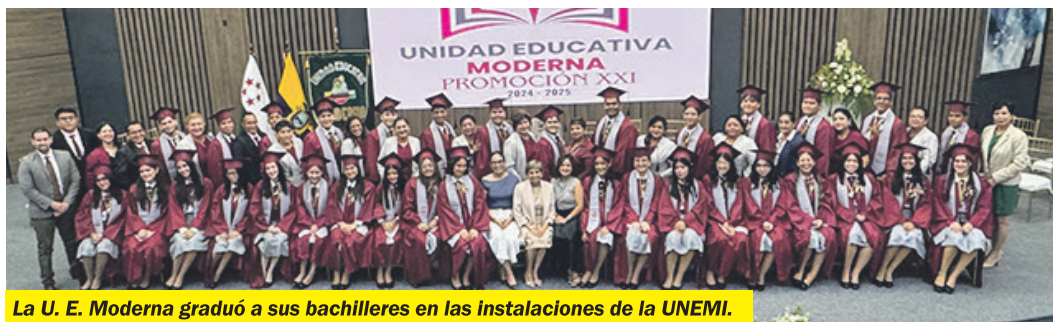
La U. E. Moderna graduó a sus bachilleres en las instalaciones de la UNEMI.

"Como universidad pública, tenemos un compromiso con la