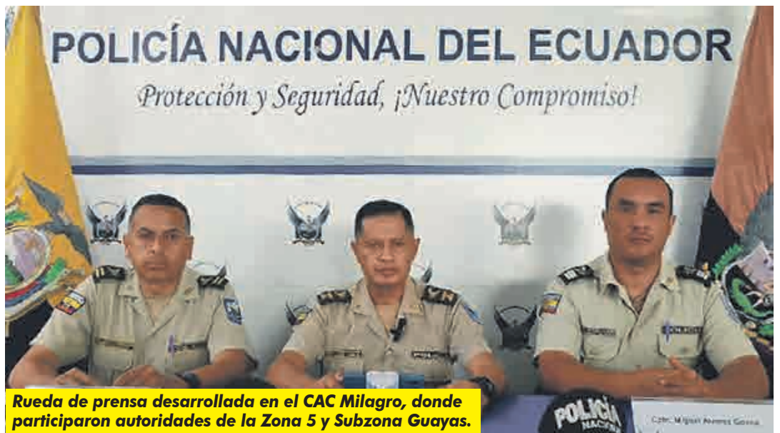
Rueda de prensa desarrollada en el CAC Milagro, donde participaron autoridades de la Zona 5 y Subzona Guayas.

“Invitamos a la ciudadanía a tener una convivencia social pacífica con todas las personas que le rodean. De esta manera, la institución policial reitera su compromiso