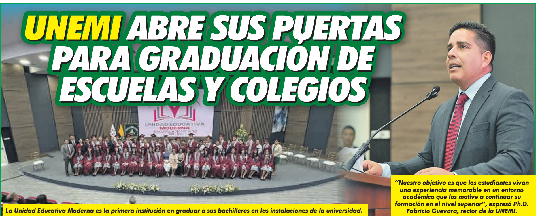
La Unidad Educativa Moderna es la primera institución en graduar a sus bachilleres en las instalaciones de la universidad.