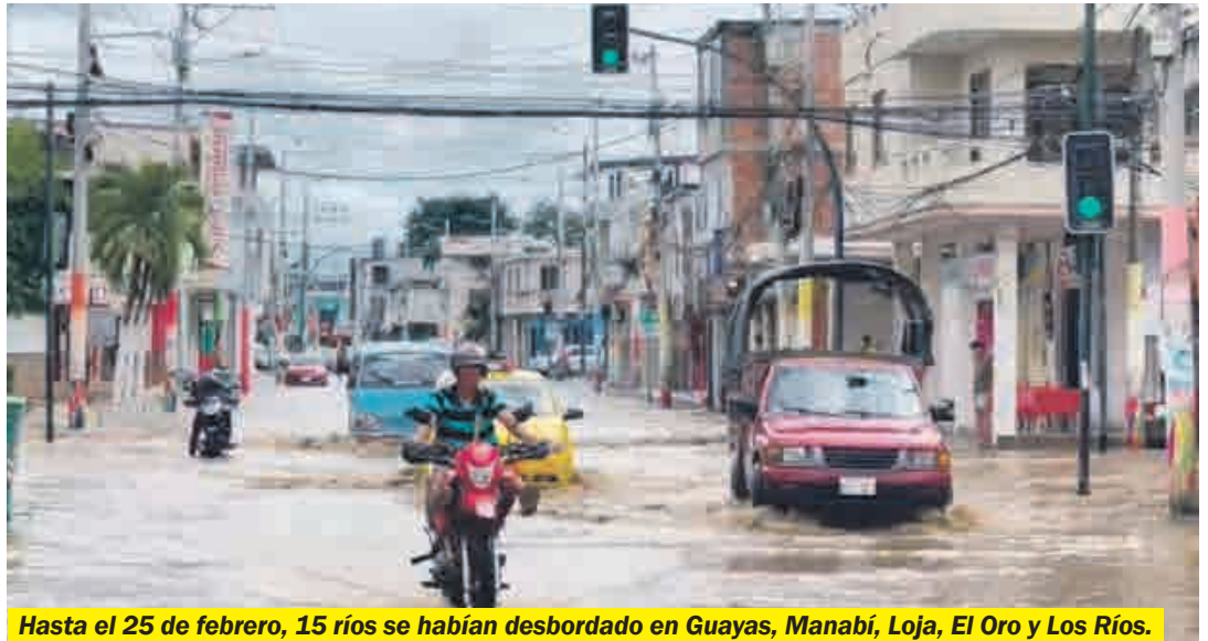
Hasta el 25 de febrero, 15 ríos se habían desbordado en Guayas, Manabí, Loja, El Oro y Los Ríos.

así como afectaciones a servicios básicos y comunicación.