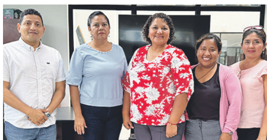
Reunión con autoridades de la Unidad Educativa Mariscal Sucre.