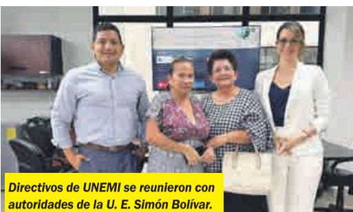
Directivos de UNEMI se reunieron con autoridades de la U. E. Simón Bolívar.