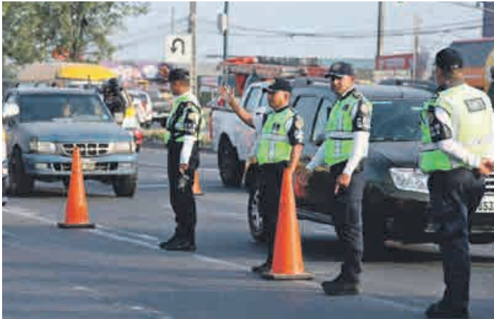
Según datos de la CTE, 657.926 vehículos salieron a nivel nacional, en el feriado de carnaval del año pasado.